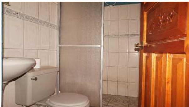
baño de ducha