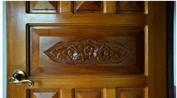
Puertas de madera maciza