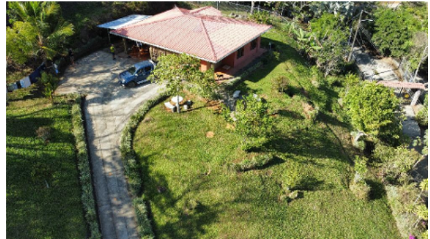
Calzada con marquesina doble