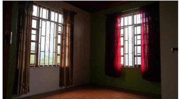
Zimmer II ca. 9,6 m 2