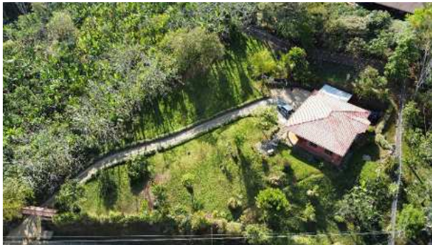
Grundstück ca. 2.400 m 2