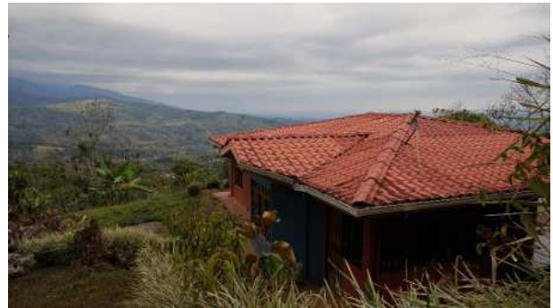
Blick nach Pérez