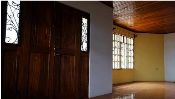
Eingang- /Wohnbereich ca. 27 m 2