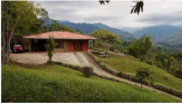
Willkommen in Miravalles