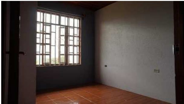
Zimmer III ca. 9 m 2